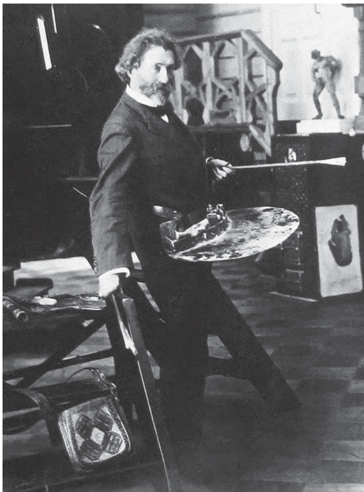
Репин в мастерской в “Пенатах”. Фотография 1905 г.