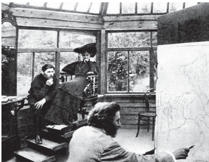
Репин, наметивший рисунок на холсте углем. Репину позировала М.Ф. Андреева, а рядом с ней – А.М. Горький. Фотография 1905 г.

непривычно (нестереотипно) выполняет движения кистью руки в момент рисования. Это может быть рассмотрено как своеобразное проявление феномена парадоксальных кинезий – улучшение моторики при изменении положения руки, кисти, пальцев,