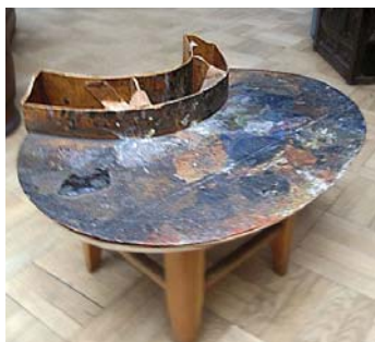
Навесная палитра Репина.

выполняемые пальцами правой кисти, а этого как раз не наблюдалось.