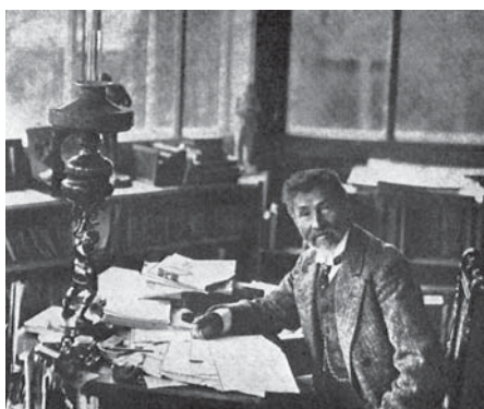
И.Е. Репин в кабинете. Фотография 1910-х годов.