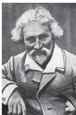
И.Е. Репин. Фотография 1915 г.