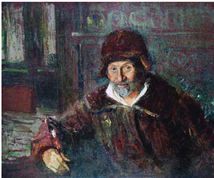
И.Е. Репин. Автопортрет. 1920 г.

Родины, и прошли последние три десятилетия его жизни.