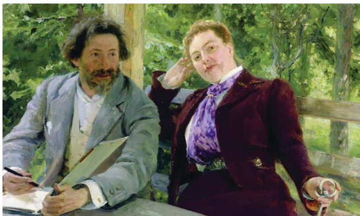
И.Е. Репин. Автопортрет с Н.Б. Нордман-Северовой. 1903 г.

Попытаемся найти факты, подтверждающие это предположение. Что касается “атрофии или усыхания кисти”, то на фотографиях И.Е. Репина и автопортретах в разные годы явных изменений правой кисти не наблюдается. Так, на одной из фотографий художника в преклонном возрасте и на автопортрете с Натальей Борисовной Нордман-Северовой видно, что кисть художника находится в расслабленном состоянии без признаков атрофии, а вот установка пальцев правой