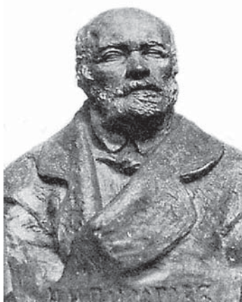
И.Е. Репин. Бюст Н.И. Пирогова. 1881 г.

Развитие творчества Репина совпало по времени с бурным расцветом фотогра-