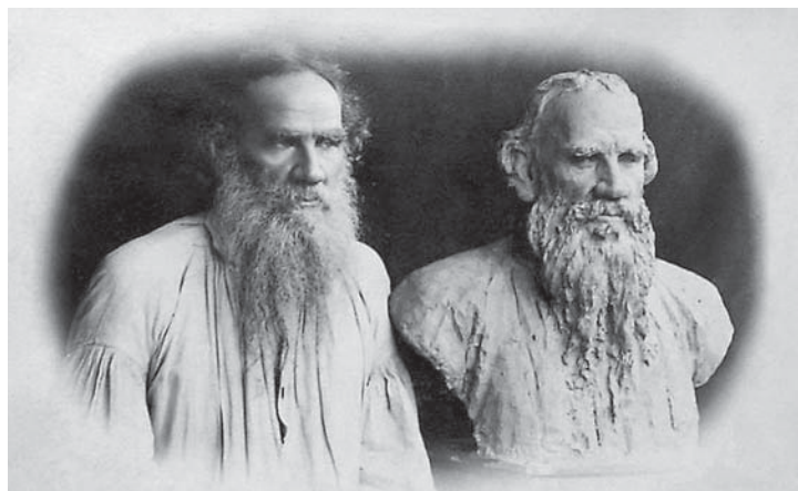
Л.Н. Толстой рядом со своим бюстом работы И.Е. Репина. Фотография 1891 г.